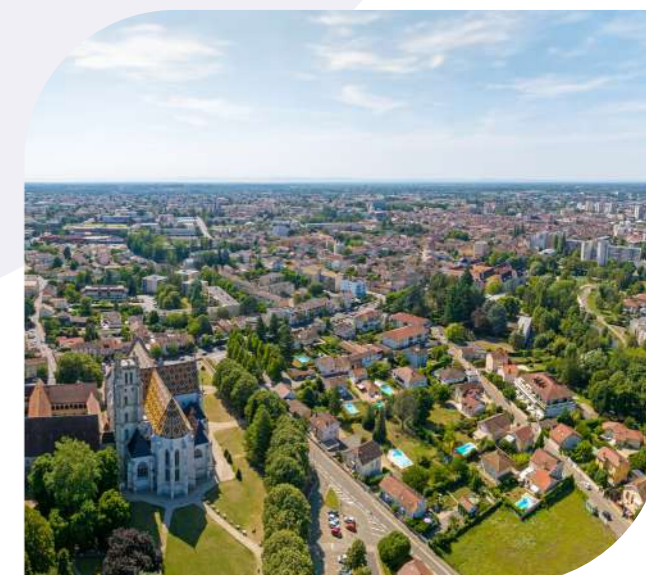
Vue de Bourg-en-Bresse et du Monastère de Brou

Entièrement tournée vers l'avenir, la préfecture de l'Ain est habitée par l'envie de se développer de manière durable, apaisée et intelligente. À l'image du nouveau parc de la Madeleine, du futur pôle « Culture - Sport - Éducation » ou de l'agrandissement du centre d'études universitaires de Bourg-en-Bresse (CEUBA), l'urbanisation bressane est empreinte d'une vitalité sans faille.